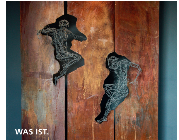
Stefanie Welk: DIALOG 2019, Stahl/Draht, 200 x 136 x 65 cm