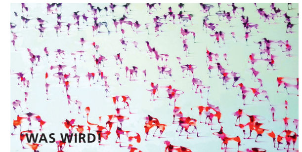
Jonathan Huxley: Worldview (Red line) 2020, Mixed-Media auf Leinwand 109 x 216 cm